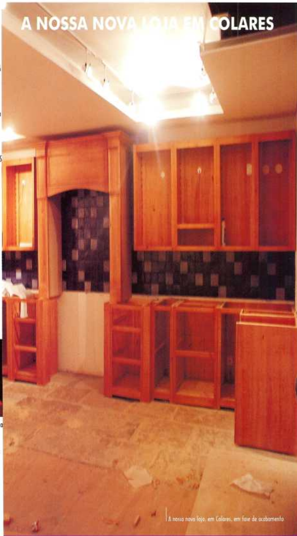
A nossa nova loja, em Colares, em fase de acabamento

"(...)Um machado bem afiado, logo de seguida, separou-me do tronco morto que tinha sido a minha mãe. Não senti grande dor. O desejo de partir, de continuar, dava-me energia para matar todo o sofrimento..."